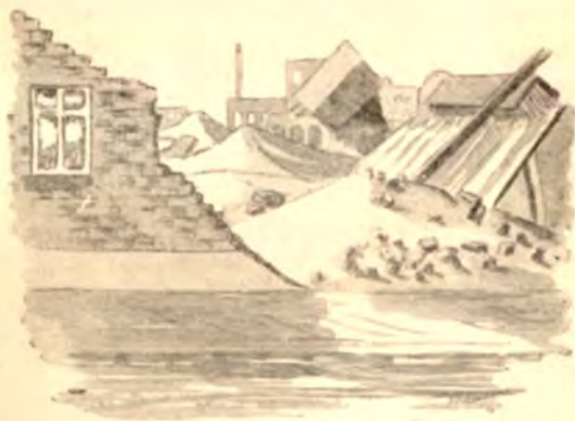
Fra et bomberamt Kvarter i Neumünster.

Naar Vognene begyndte at køre, blev Folk staaende paa Trinbrædtet eller hagede sig fast til Kanten ved Vinduerne. Det var, som om Glæden over, at vi