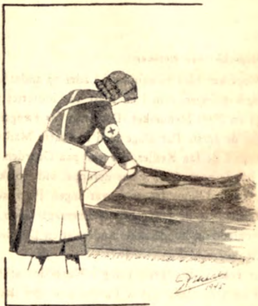
D. K. B.-Damer hjalp os med vore syge i Møgelkær.