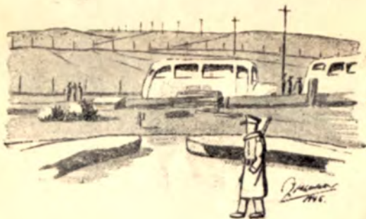
Bilerne til Sverigestransport ankommer til Møgelkær.

Jeg havde ellers tænkt mig, at min „underjordiske“