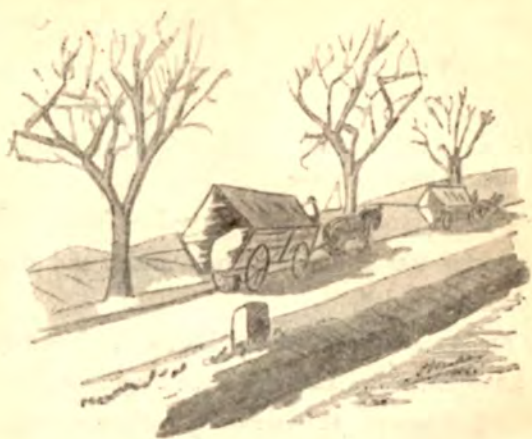
Flygtninge fra de krigshægede Egne er undervejs.

i Medisterpølse med Kartoffler og en Øl til. Det var Sager, der smagte os! Saadan Mad havde vi ikke set i Maaneder.