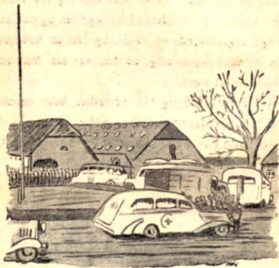
Transport mod Sverige skal afgaa fra Møgelkær.